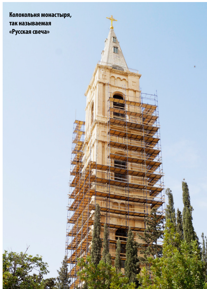
Колокольня монастыря, так называемая «Русская свеча»

Иду за порог, в притвор храма. Стою. Подходит монахиня. Говорит, что мне там нельзя стоять. Как-то строго, но не грубо, так что мне не было обидно. Она отвела меня к тому месту, где стояли мужчины, – справа от алтаря. Сейчас, кстати, стало менее строго, часто паломники держатся все вместе – и мужчины, и женщины. Стою, и вижу перед собой удивительную икону Божией Матери – «Взыскание Погибших». Тогда, конечно, я не знал, что она так называется, но чувствовал, что Она зовет всех погибших людей, и меня в том числе, к Себе. Рядом был монах, как я понимаю сейчас, выросший в Америке. Мне повезло, и он стал со мной говорить по-английски. Когда читали кафизмы, он показал мне, что