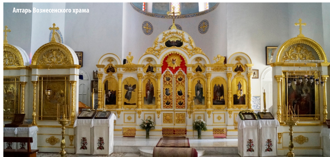
Алтарь Вознесенского храма

Тем временем продолжал работать в книжном магазине, но иногда оказывался на грани отчаяния. Из-за моей занятости в театре я не раз откладывал крещение – назначенный день совпадал с